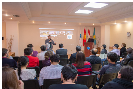
Кемел Трой хоёр ТАИС дээр болсон Иргэдийн Шинжлэх ухаан хурал дээр яриа хийж байгаа нь. Кыргызын Ерөнхийлөгч асан Роза Отунбаева урд эгнээнд байна.

Дэгдээд буй Титэмт вирусээс болоод ирэх саруудад төлөвлөөд байсан аяллууд хүлээлтийн байдалтай байна. Багийн гишүүд, хамтрагчид болон найзууддаа энэ хэцүү цаг үед эрүүл энх байхыг хүсэн ерөөе!