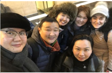
Монголын багийн уулзалт